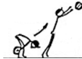
Schockwurf von unten

Die Wurfart ist beliebig (bis auf Schleudern).